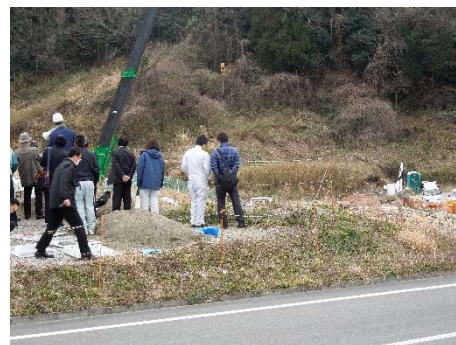
伊達方発電所の建設現場見学の様子