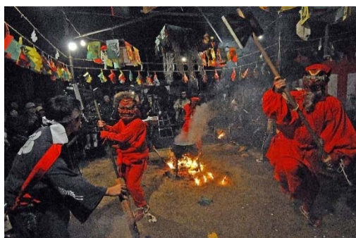
－ 準特選 「山の神乱舞」 －