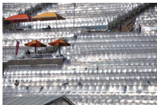
－ 準特選 「石垣苺のビニールハウス」 －