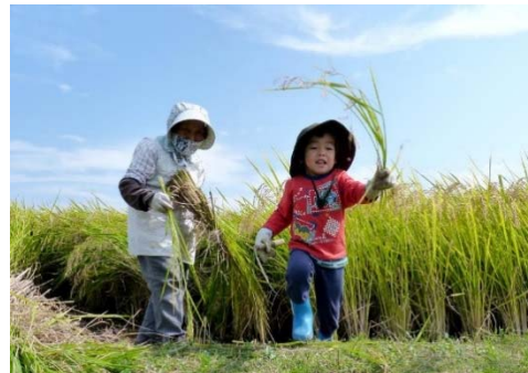
－ 準特選 「曾孫もお手伝い」 －