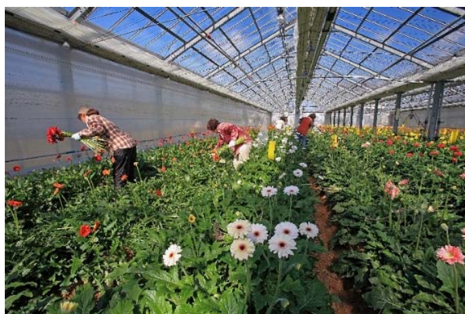
－ 特選（静岡県知事賞） 「ガーベラハウス」 －

これらの入賞作品は、2月24日（水）～3月3日（木）に県庁別館 21 階ロビーにて展示されました。