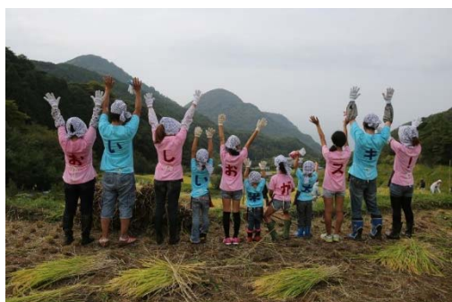
－ 準特選 「未来へ向って」 －