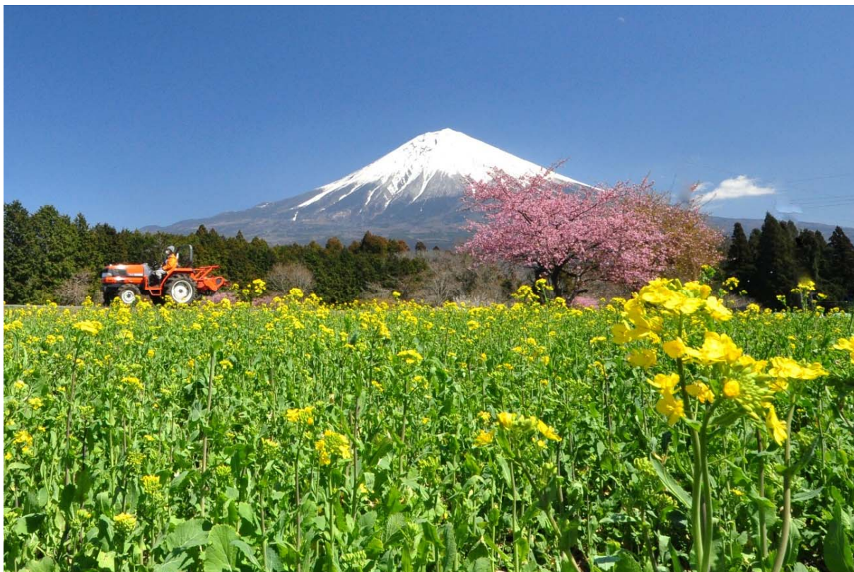
写真：第1回 静岡県農村の魅力フォトコンテスト 応募作品