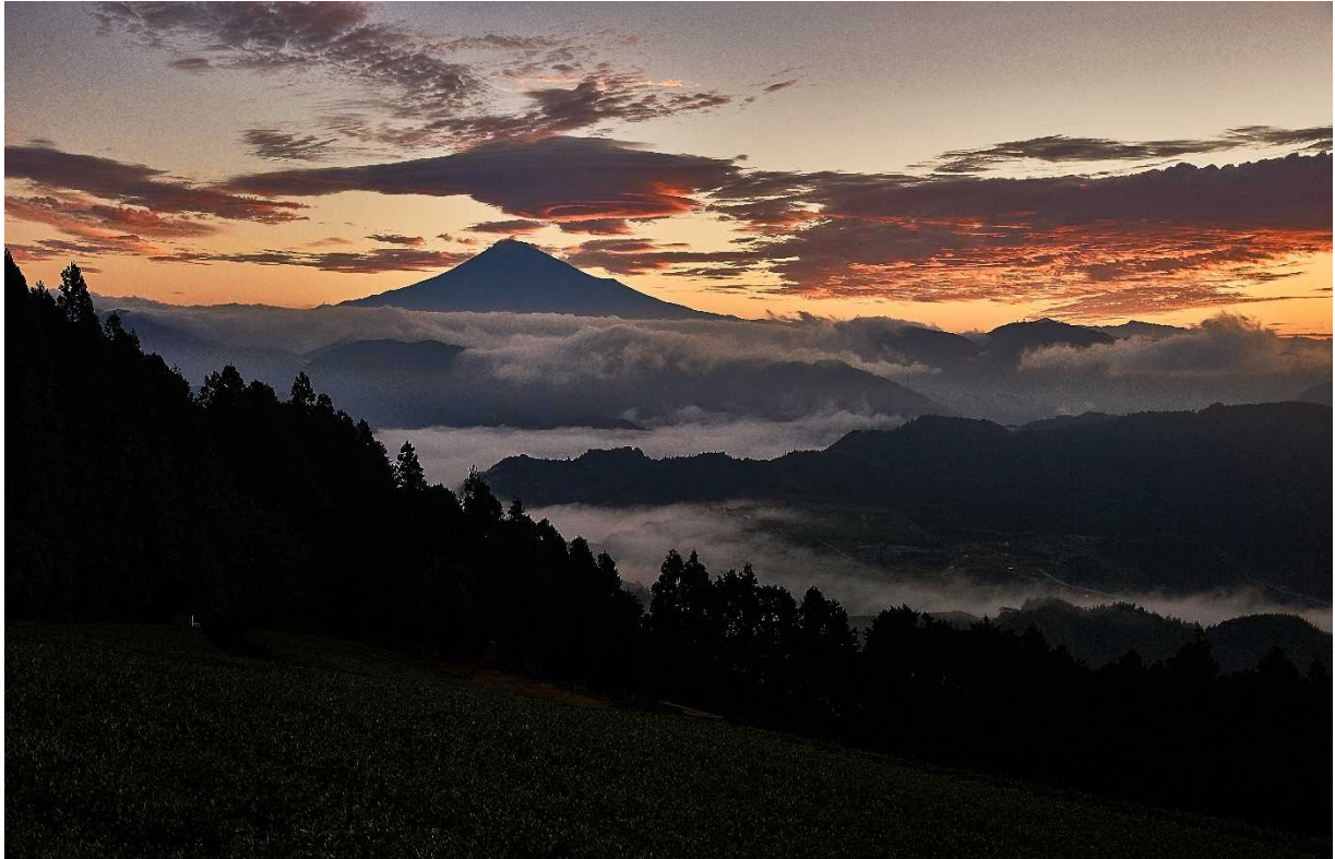
第5回 静岡県農村の魅力フォトコンテスト 入選作品（静岡市清水区 吉原地先）