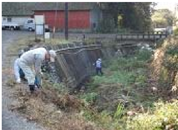
水路周りの草刈作業風景