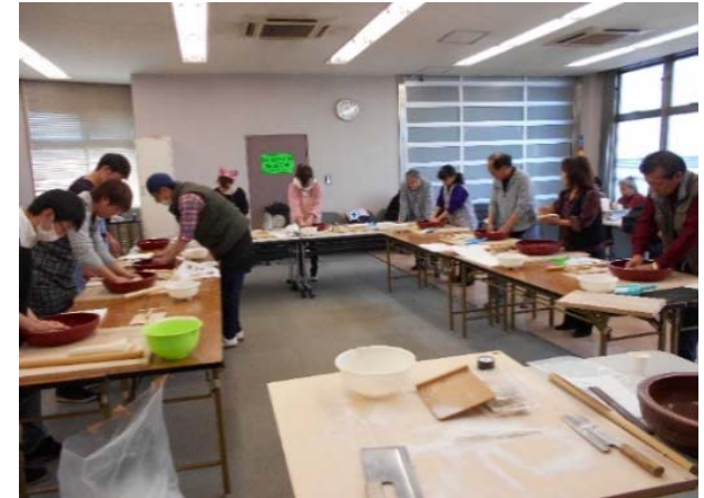
そば打ち体験での地域住民との交流