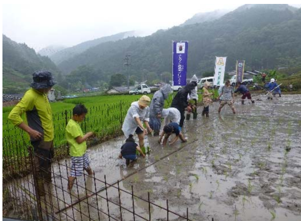
小学生との田植え体験の様子