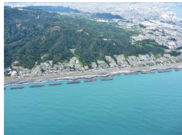
航空写真 (R1.10.27撮影) 地区全体の様子