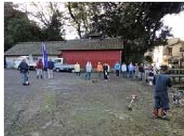
草刈作業集合写真