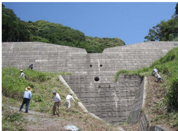
水路の清掃の様子