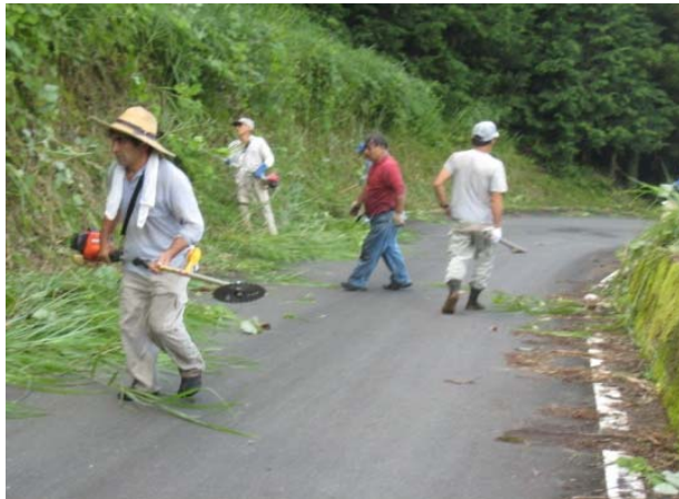
農道の路肩法面の草刈り