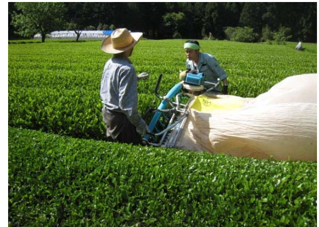
地元企業の方を招いたお茶の収穫体験