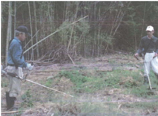
農地保全の草刈り