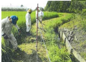
防護柵の下草刈り風景