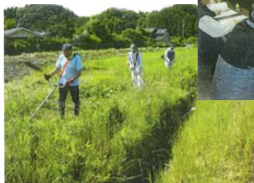
非農家による草刈り風景