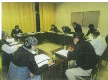
意見交換会の風景

●活動組織が中心となって集積を進め220戸の農家を20戸の農家に集約した。土地持ち非農家を中心に草刈りなどの維持活動を行っている。