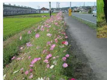
植栽したコスモス