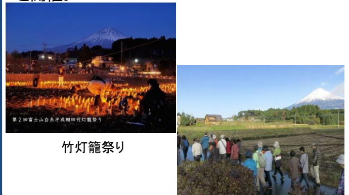
第2回富士山白糸平成棚田竹灯籠祭り

● 棚田を竹灯籠で照らす「棚田竹灯籠祭り」、棚田を巡るウォーキングイベントや農業体験を開催。