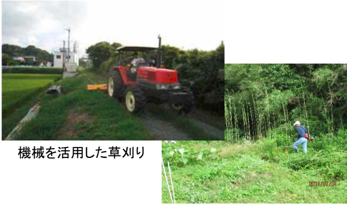
機械を活用した草刈り