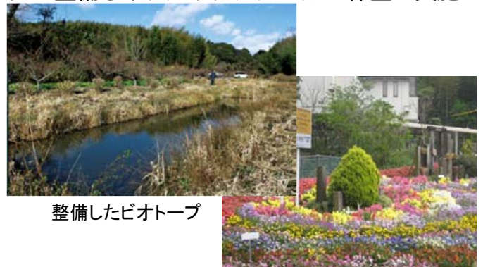
整備したビオトープ