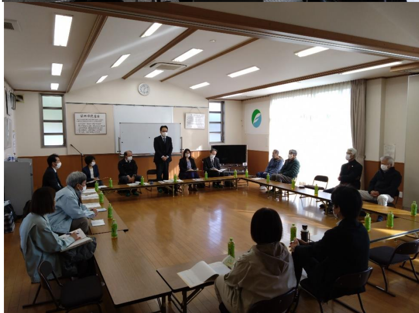
いまい保全の会 (太田自治会館)