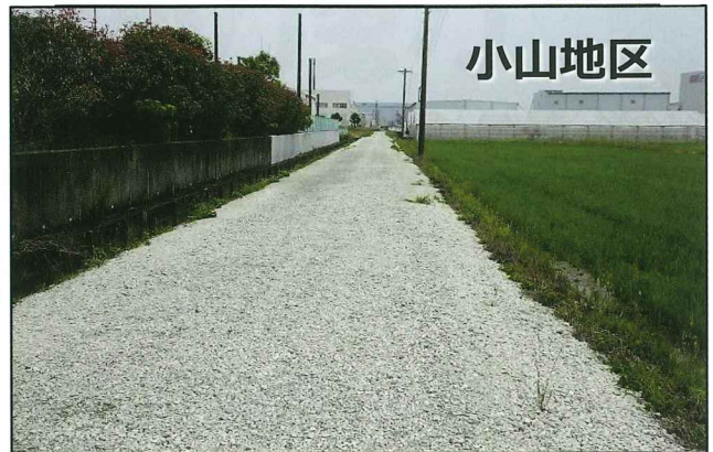
農道に砂利を敷き路面を維持