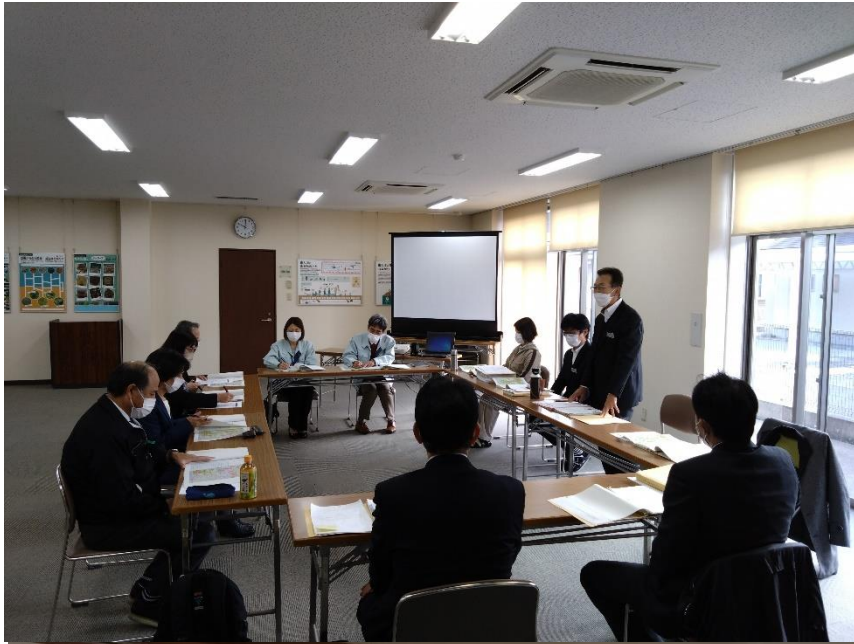
磐田用水東部土地改良区