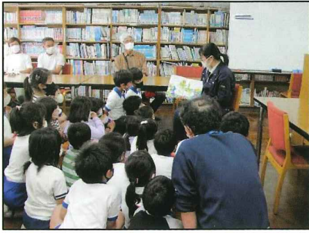
野菜の学習（読み聞かせ）