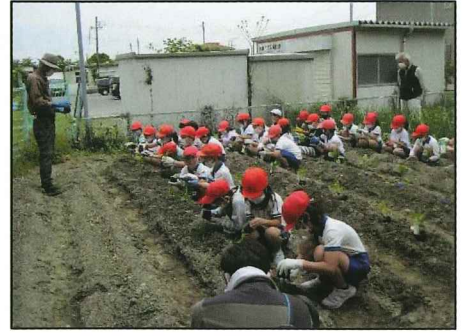
5種類の野菜の定植