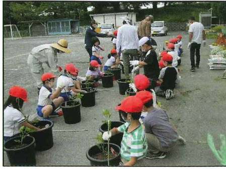
ミニトマトの定植