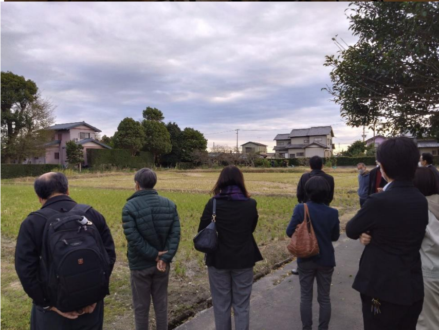
いまい保全の会 (学校との連携圃場)