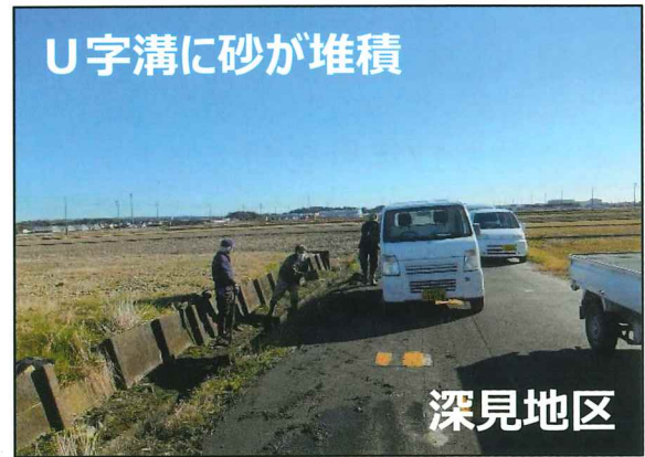
施設等の定期的な巡回点検・清掃