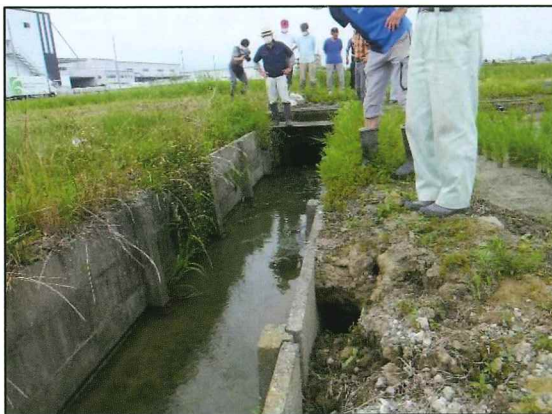
排水路法面の陥没を確認！