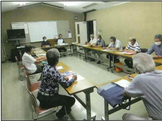
今井の『人・農地プラン』検討