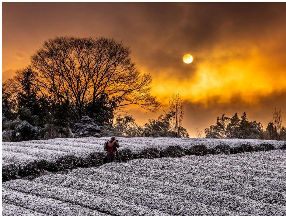
白き大地 燃える空