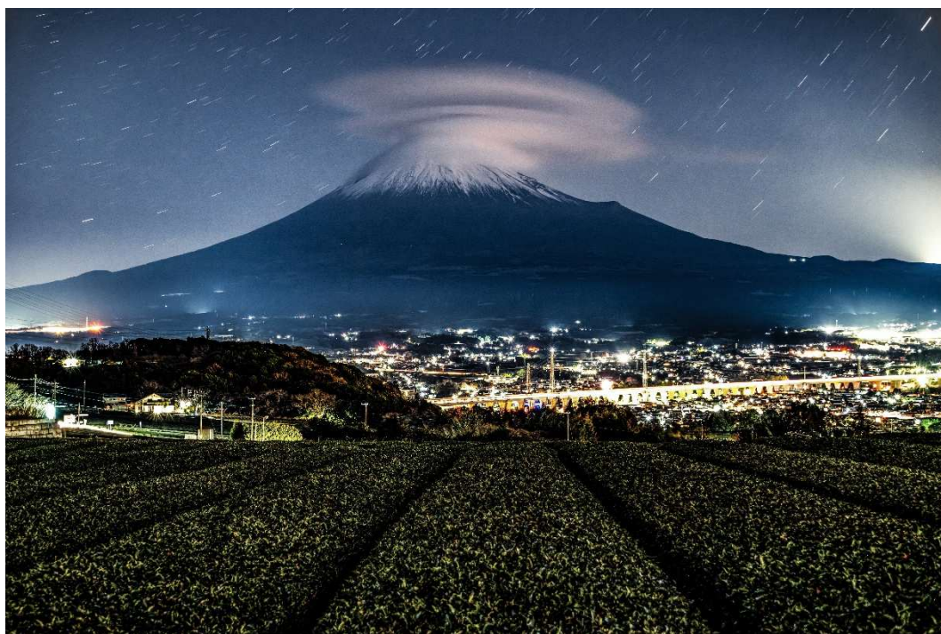
夜の茶園と幻想笠富士