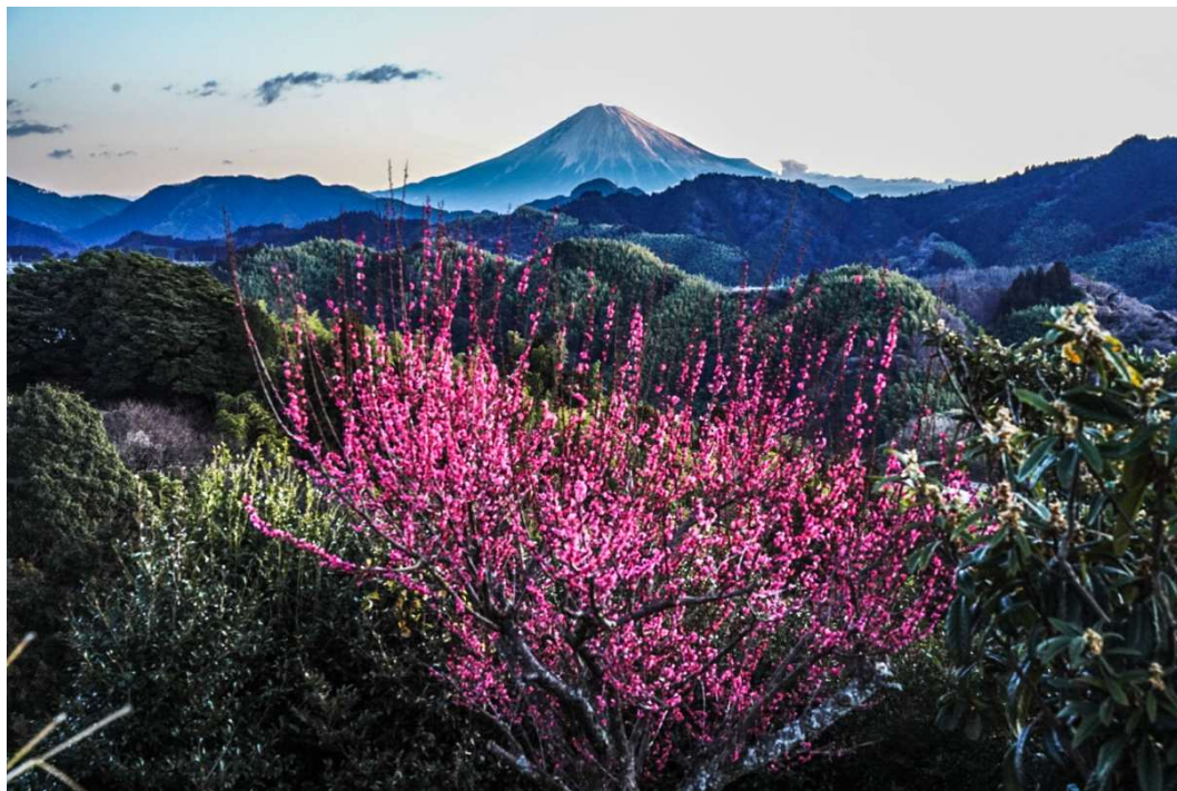
今朝の富士山 紅梅