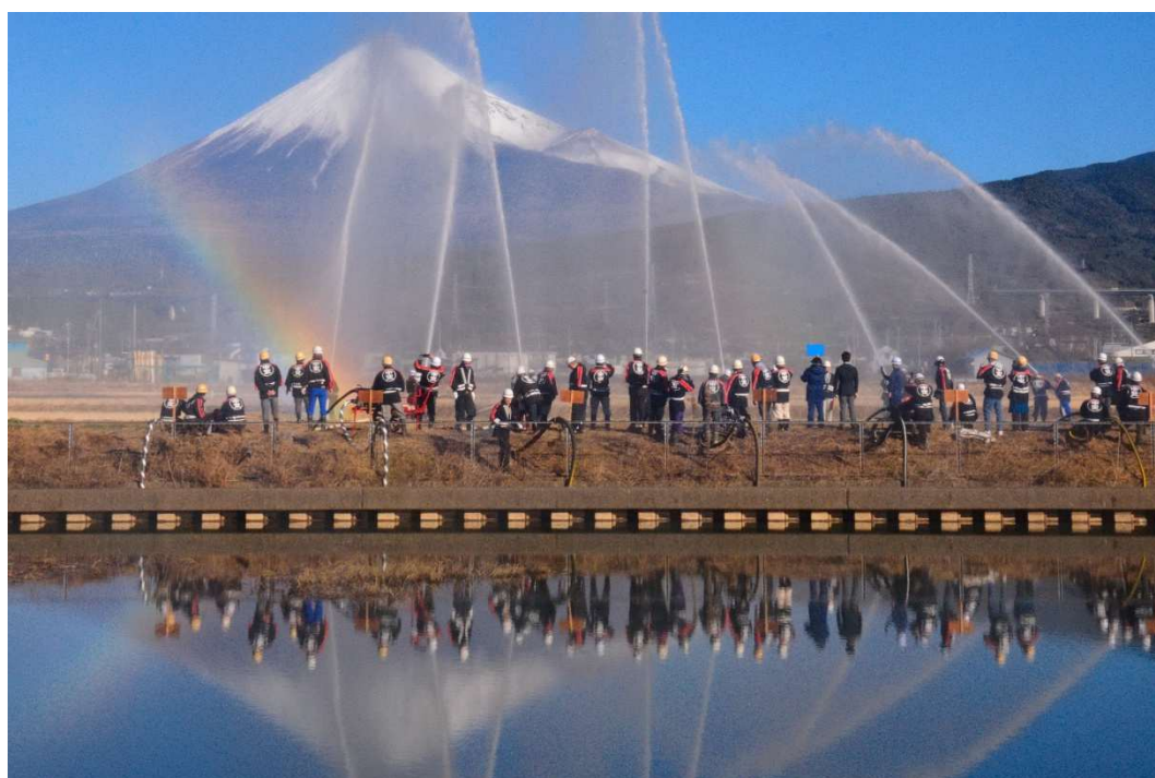
青空の新年一斉放水