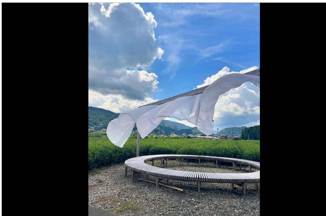
まっしろなカーテン