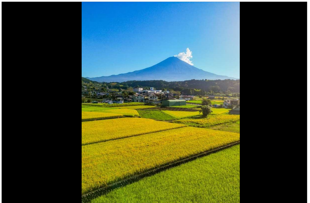
黄金色の田んぼと富士山