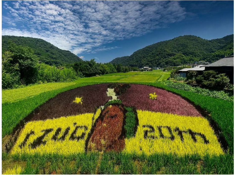
水田アートその後