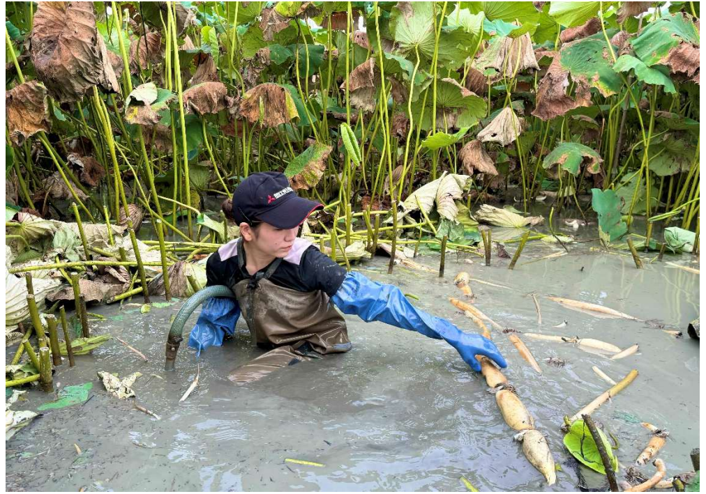
おなご職人 撮影地：浜松市中央区神ヶ谷町 たけむら農園