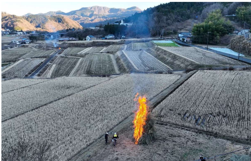
近代的な段々畑とどんど焼き