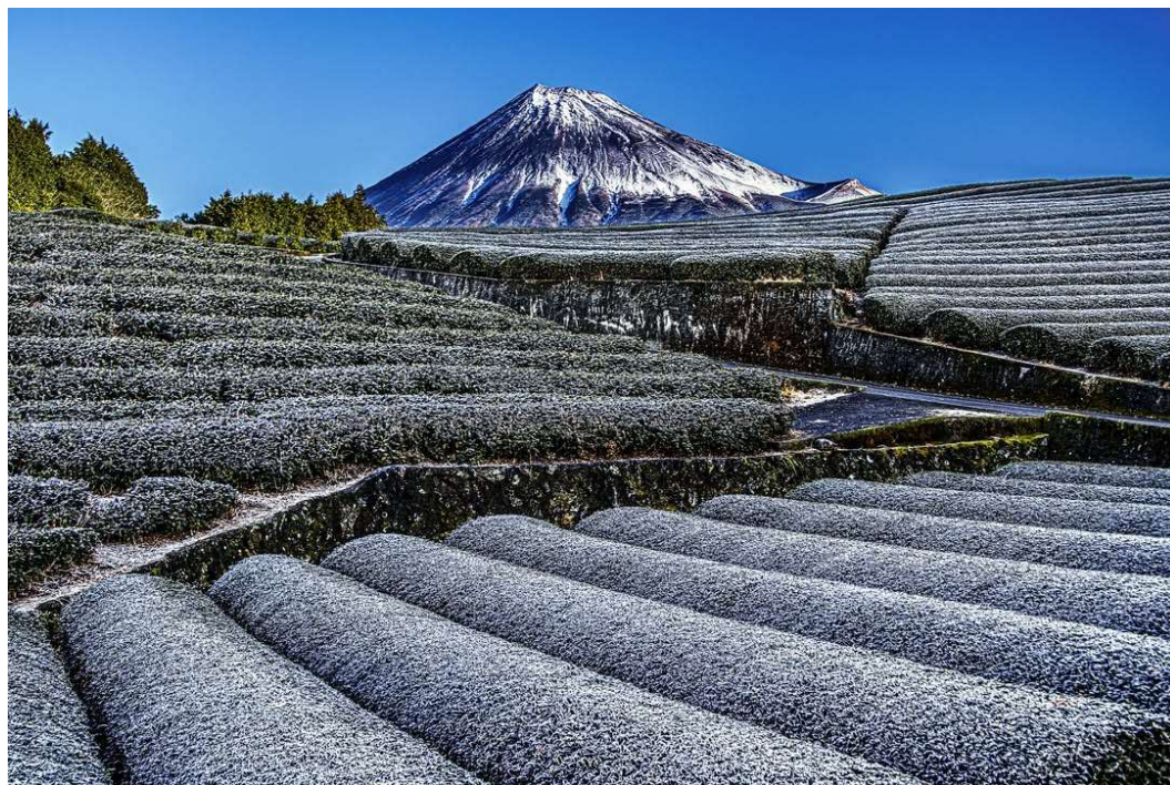
霜降る茶畑越しの富士