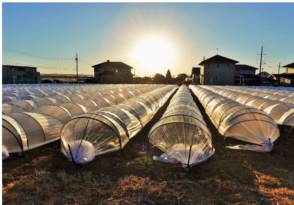
新春の日射し 撮影地：浜松市中央区伊左地町