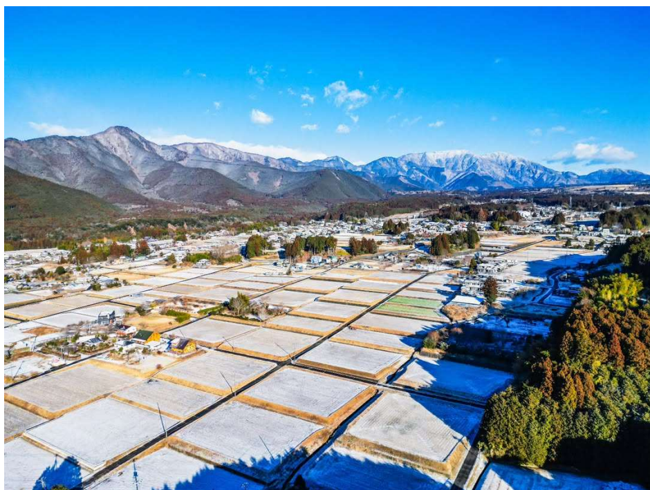
雪積もる棚田の朝