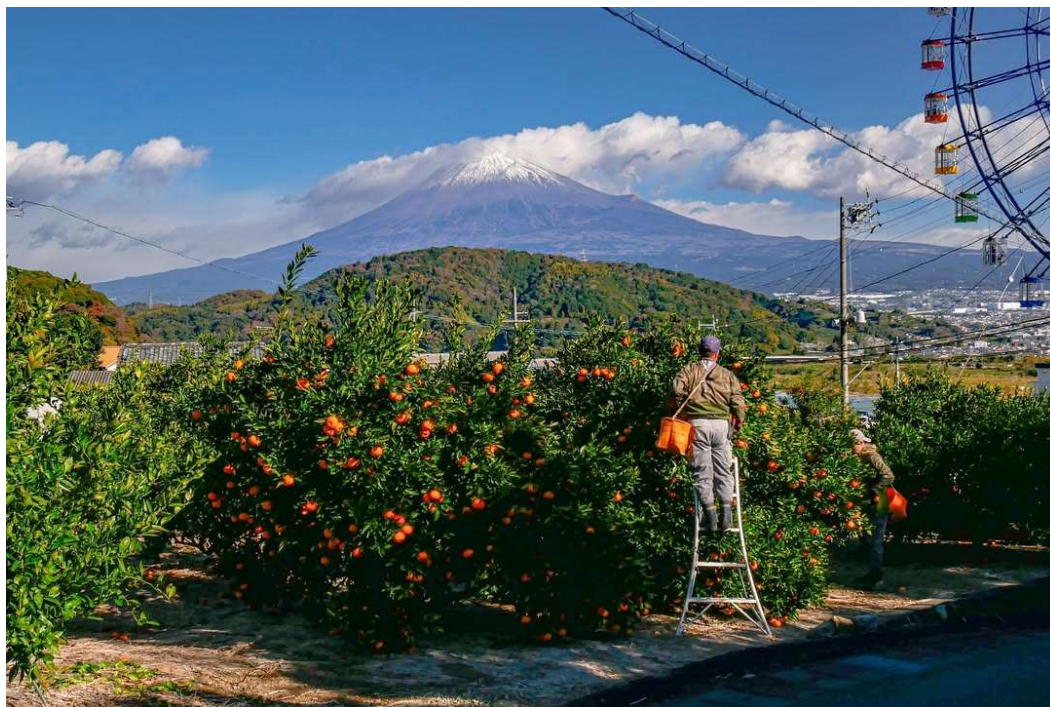
みかんの収穫最盛期