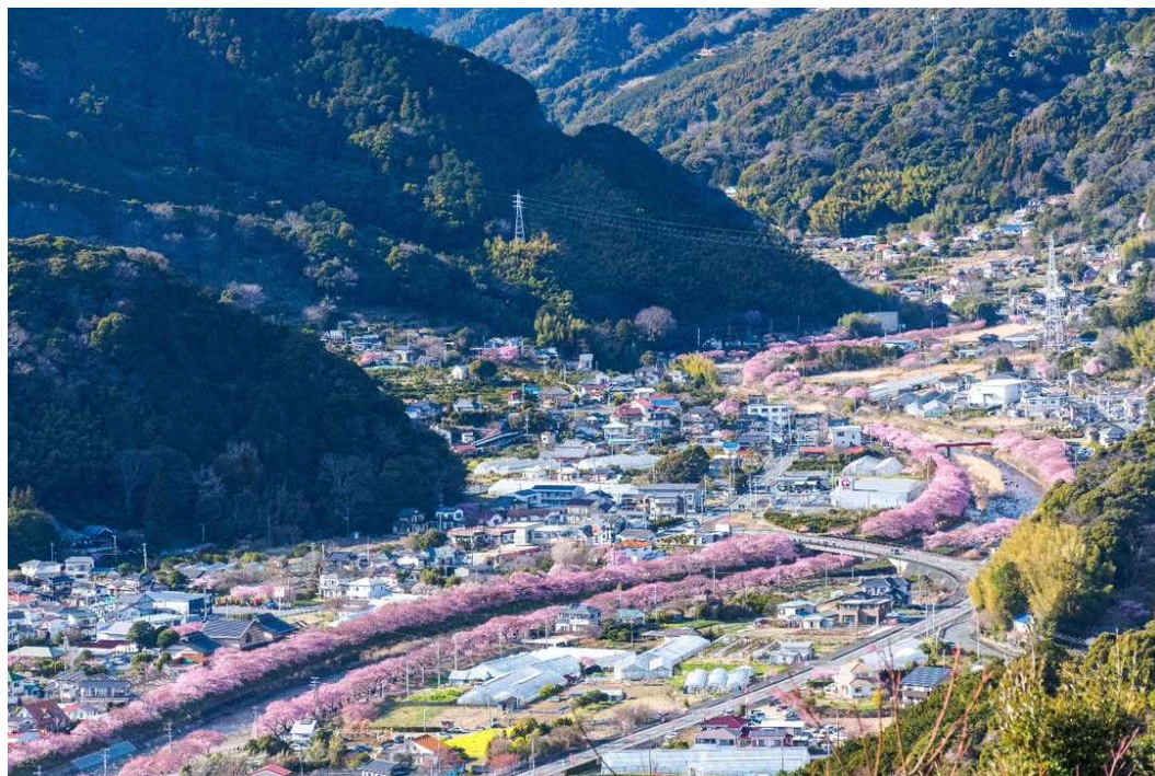
春の訪れを告げる河津桜並木 撮影地：河津町 (河津桜とねはんの里 沢田)