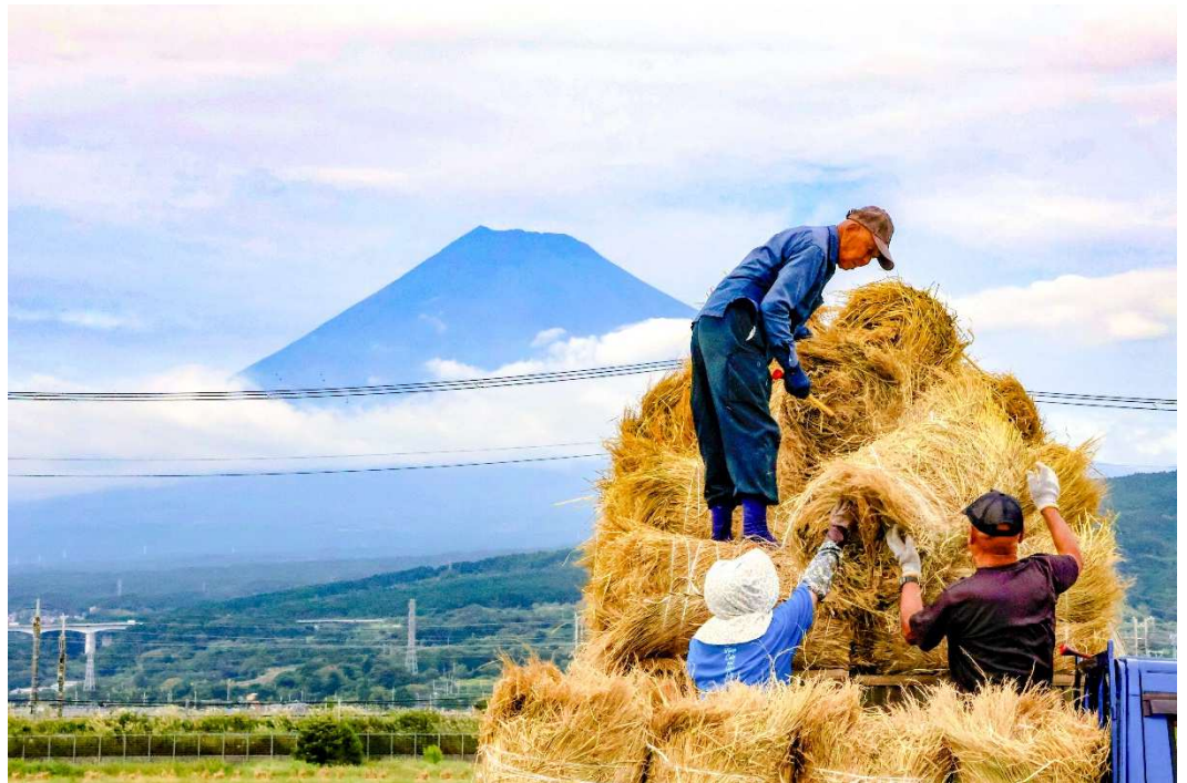
稲積み処理作業と富士山