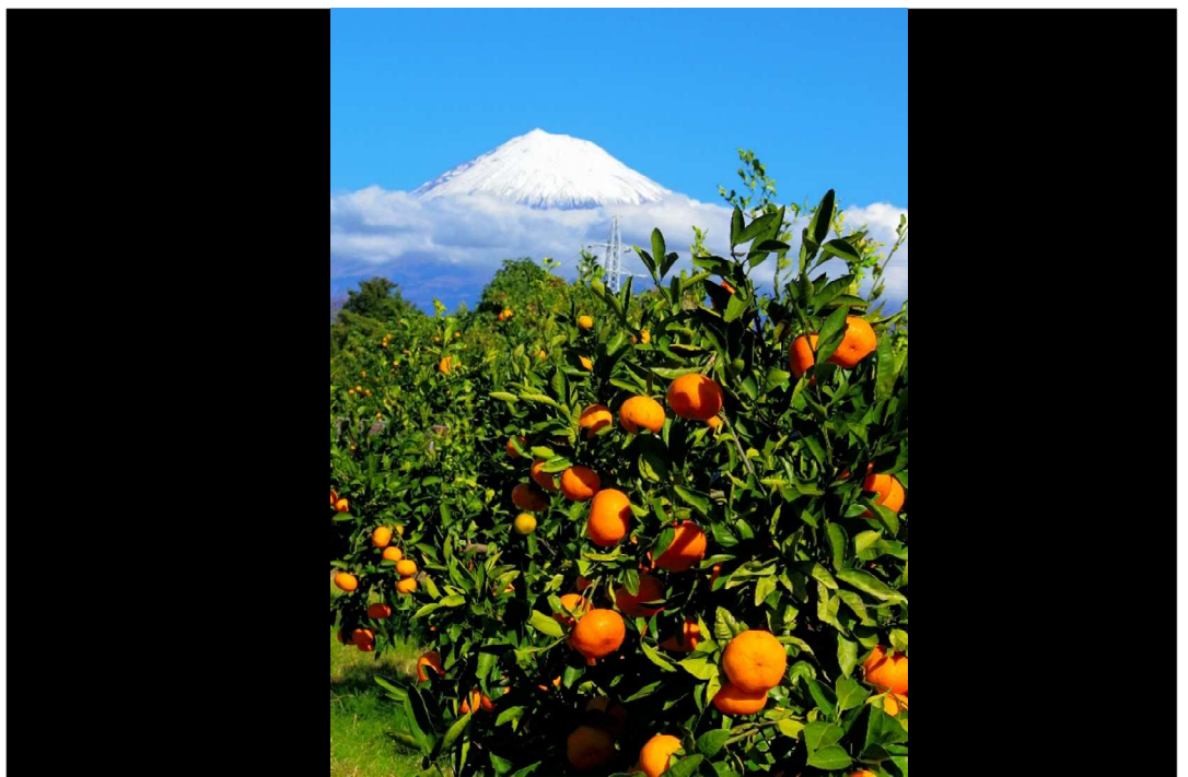
収穫間近のミカン畑