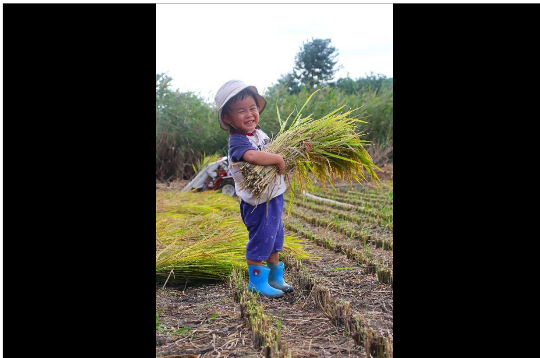
あふれる笑顔と黄金色