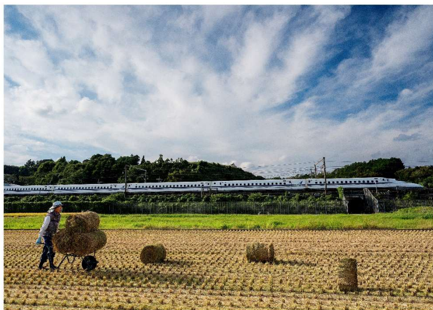
収穫が終わり牛のエサ