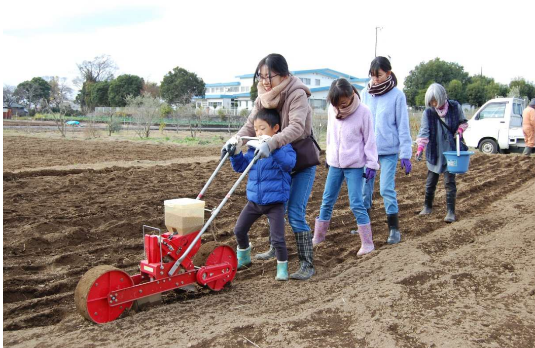
種まき列車「小麦号」出発