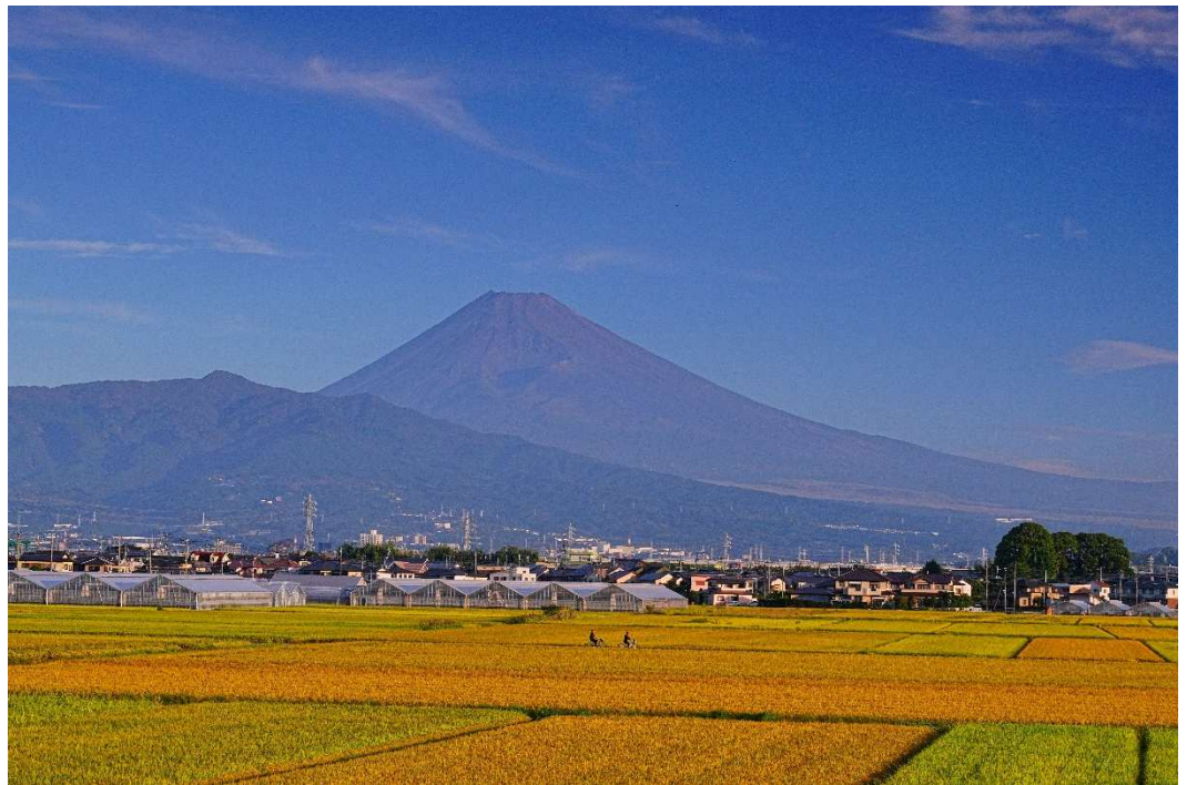
田園のイエローカーペット