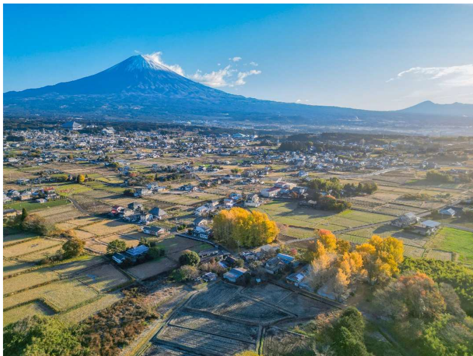
富士山麓の朝棚田日和