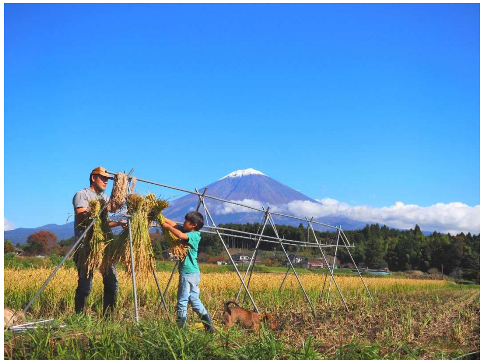
力を合わせて稲架掛け