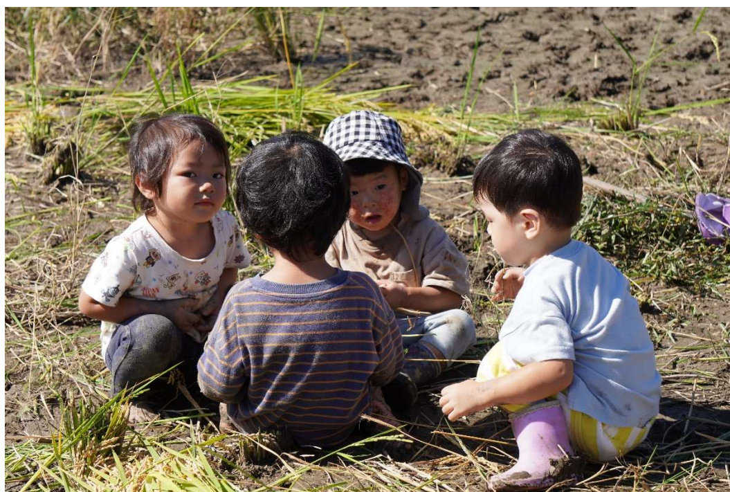
田んぼで1歳児会議